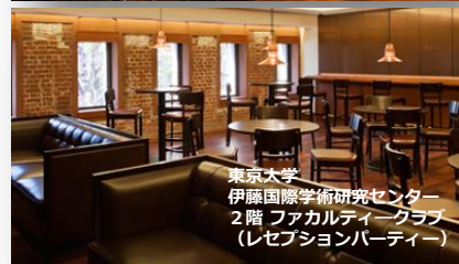
東京大学 伊藤国際学術研究センター 2階 ファカルティークラブ (レセプションパーティー)