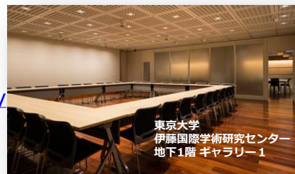
東京大学 伊藤国際学術研究センター 地下1階 ギャラリー1